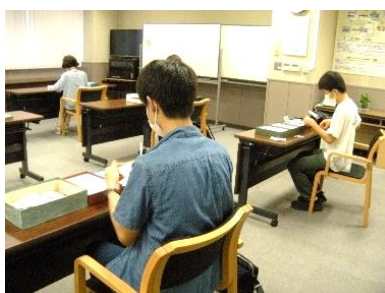
スタンプの会 使用済み切手の整理分類ボランティア