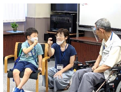
中央区聴覚障害者協会 中央区登録手話通訳者の会