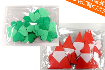
保育園・児童館などで使用する 装飾づくりのお手伝い