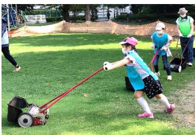
育てる芝生～イクシバ！プロジェクト 芝生育てボランティア