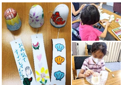
社協 ボランティア・区民活動センター 高齢者福祉施設へ風鈴を送ろう！