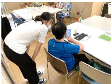
社協 管理部地域ささえあい課 おとなりカフェ・ちょこっと相談会