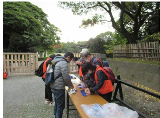
落ち葉清掃の様子 （浜離宮恩賜庭園）