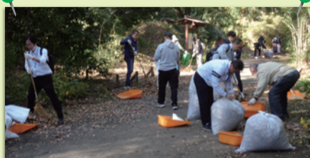
ワーキンググループ活動の様子