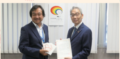
株式会社メディパルホールディングス様