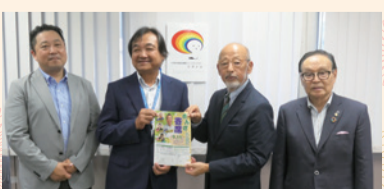
公益社団法人京橋法人会第7・8支部様

皆さまからいただきました貴重なご寄付は、 本会の社会福祉事業等に活用させていただきます。