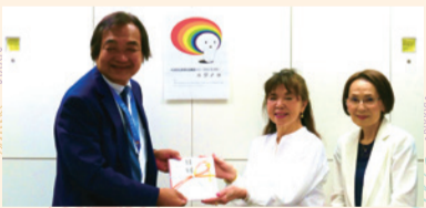
21東京パイロットクラブ様