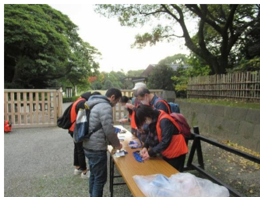
落ち葉清掃の様子 （浜離宮恩賜庭園）