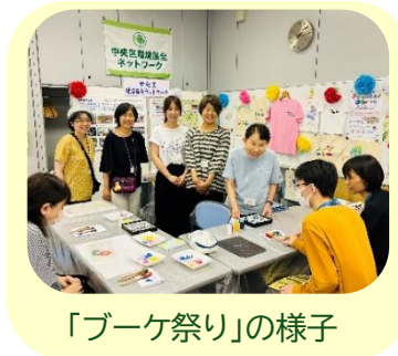
「ブーケ祭り」の様子