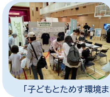
「子どもとためす環境まつり」の様子